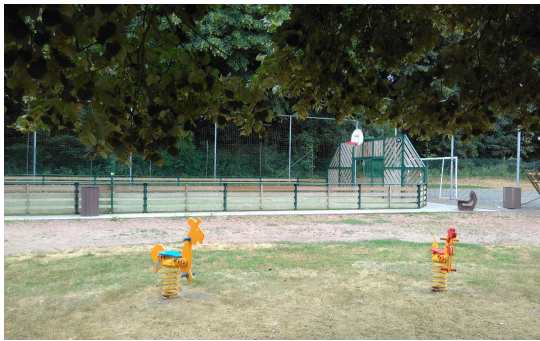
Agora Space de Chièvres : se donner les moyens pour répondre aux attentes des jeunes.

Avec les jeunes, mettre en place un Mouvement de Jeunesse , lui permettre de disposer de locaux pour se réunir dans les divers villages de l'entité, engager un éducateur de rue , un animateur socio-culturel chargé d'encadrer la jeunesse chiévroise et de lui proposer diverses activités répondant à sa demande. Afin de permettre aux jeunes couples de rester sur l'entité, mettre à leur disposition des logements à petit loyer , avec possibilité d'achat ultérieur du bâtiment à prix compétitif (projet « Tremplin »).