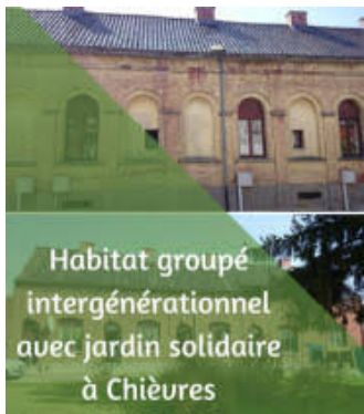
Un bel exemple de solidarité. A reproduire.

Augmenter le lien social et la convivialité dans les quartiers et les villages, encourager les initiatives-prétextes à la rencontre de citoyens. Soutenir équitablement les associations culturelles et sportives villageoises ainsi que les gestionnaires des structures telles que le Centre culturel et sportif de Tongre Notre-Dame ou encore le Comité des voisins de Tongre Saint-Martin, réels moteurs de la vie villageoise .