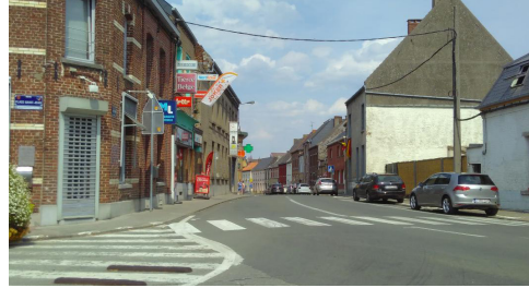
Goulot de la rue Saint-Jean : un lieu à sécuriser.

En concertation avec la police de proximité, renforcer la prévention et enrayer les comportements dangereux (vitesse excessive via l'achat de radars répressifs) ou inciviques (dépôts sauvages via l'achat de caméras, incinération, tapage diurne et nocturne). Améliorer la qualité de l'espace public (éclairage, passages pour piétons, pistes cyclables sécurisées).