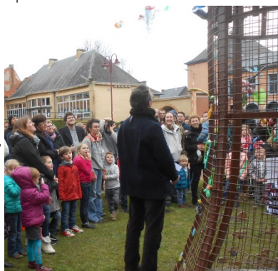
Arbre de la convivialité au Parc communal de Chièvres : animation dans le cadre des Journées wallonnes de l'eau.

Réinstaurer le rôle de « cantonniers » et de « gardes-champêtres », relais indispensables au respect de la propreté et de la réglementation communale.