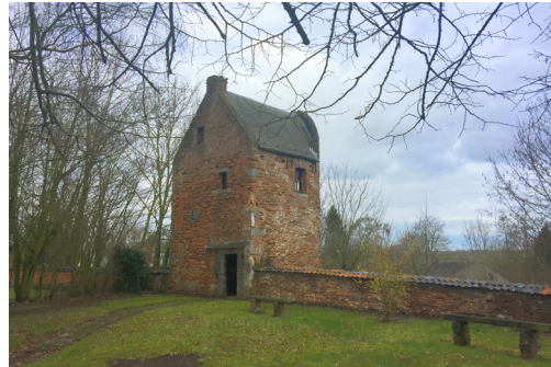
Photo de la tour de Gavres et de l'Eglise St Martin : des sites à préserver urgemment.

Développer le tourisme en dynamisant le partenariat avec les différents mouvements associatifs locaux ; Baser le développement du tourisme sur notre patrimoine architectural et naturel : en mettant en œuvre la réhabilitation progressive des principaux sites classés et leur visibilité via des parcours adaptés, des visites guidées, des circuits permanents, des panneaux didactiques, la location de vélos,... Professionnaliser l'équipe de l'OTC, revoir les stratégies et les moyens mis en œuvre pour valoriser nos richesses.